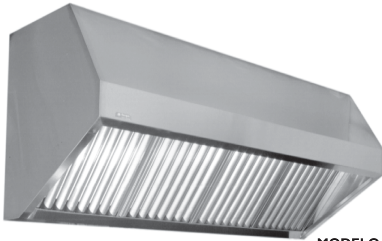
MODELO CMIZ- 750/1000