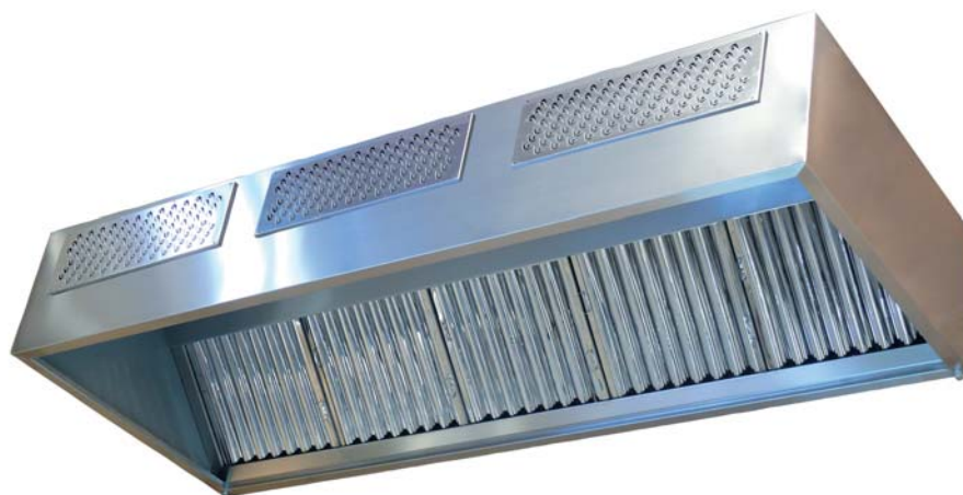
Módulo CPRS-450 con rejilla de aporte (opcional)